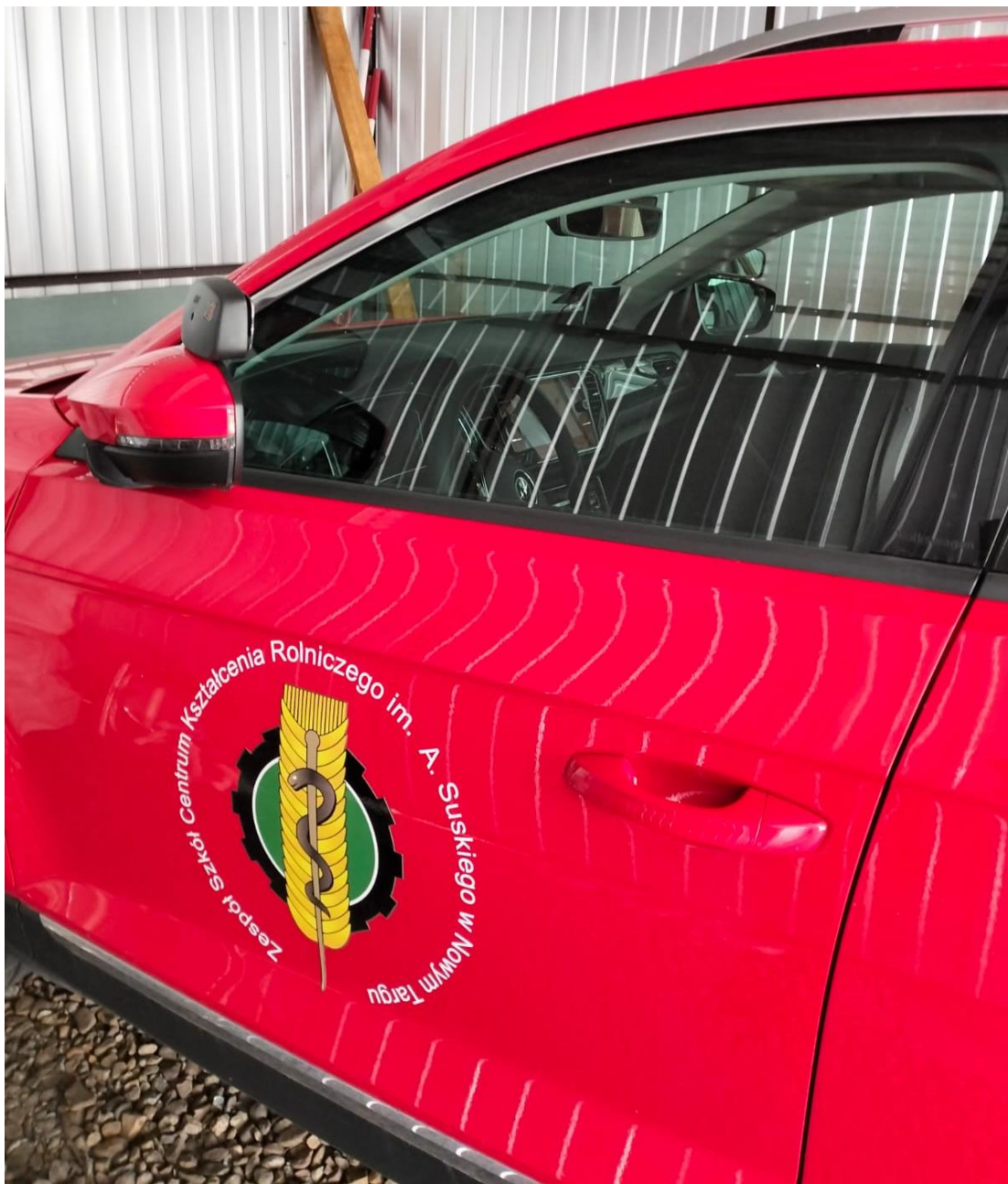
Logo – projekt dostarczony w dniu podpisania umowy: